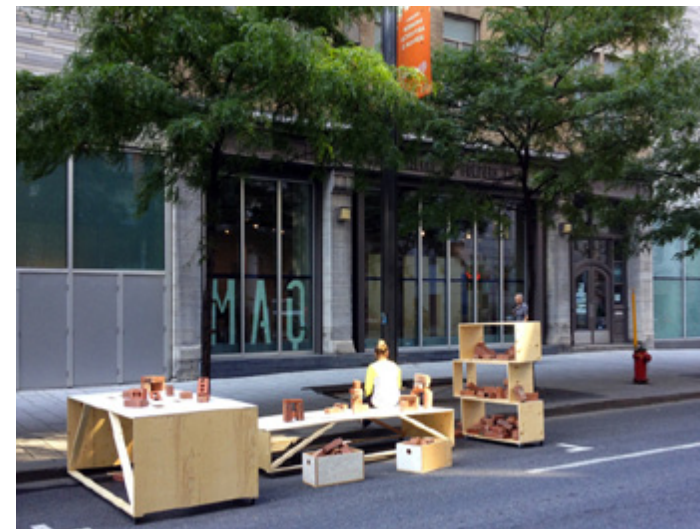
Parking Day à la MAQ - 2013