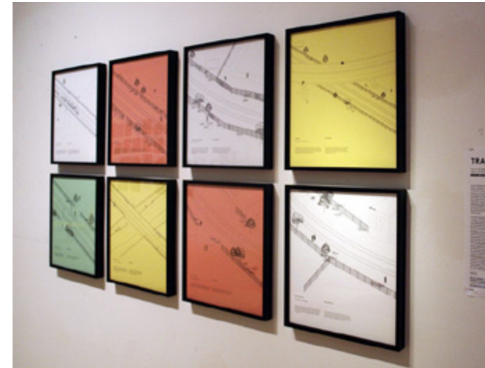
Exposition ABC : MTL au CCA - 2013