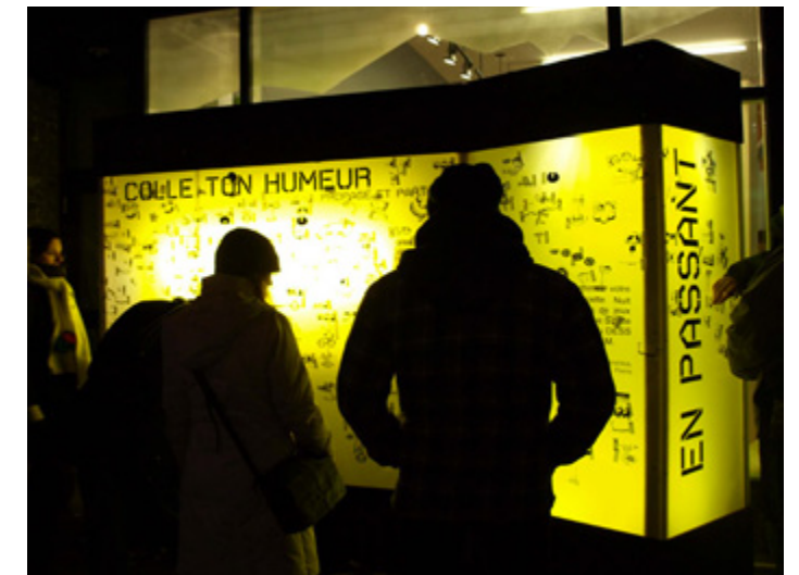
Nuit Blanche - 2011