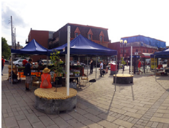
Mobilier mobile permanent pour le Marché Frontenac - 2013