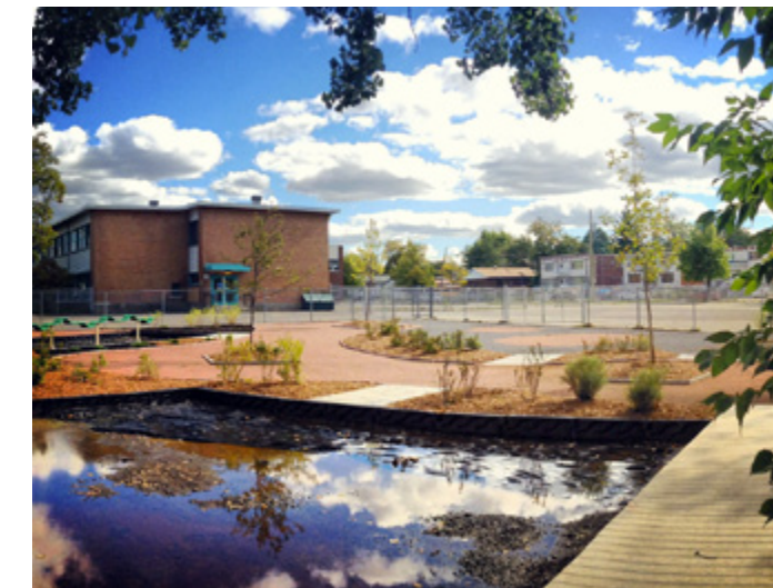
Concours Jouons Ensemble organisé par l'AAPQ - 2013