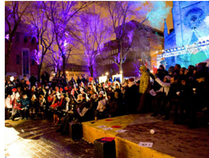
POW WOW! pour les rendez-vous du cinéma québécois - 2011