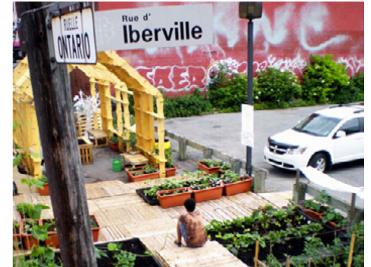
Marché Frontenac - 2011