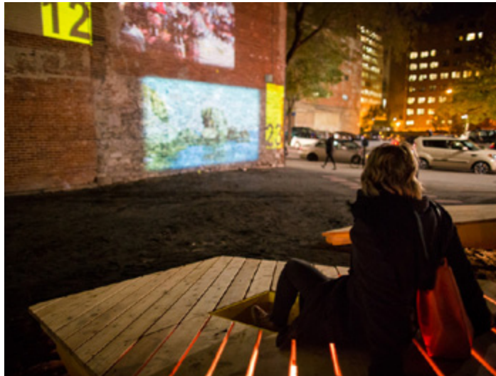
Pédaliers à images pour les RIDM - 2013